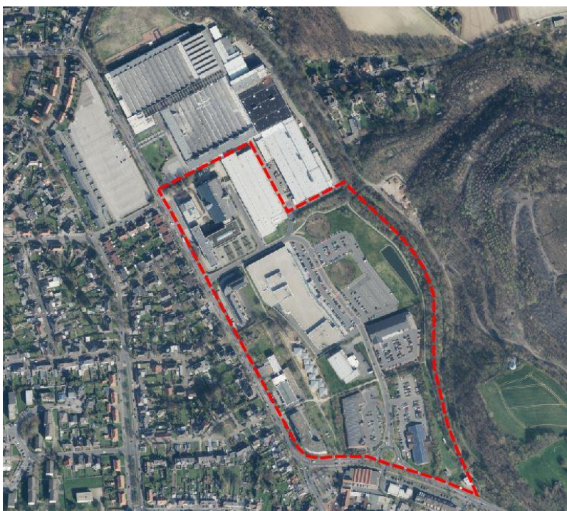
Abbildung 1: Geltungsbereich des Bebauungsplans Nr. 71 (rot markiert)

Insgesamt erstreckt sich das Plangebiet über eine Fläche von ca. 14,2 ha. Die genaue Lage des Untersuchungsgebietes kann der Planurkunde und der nachfolgenden Abbildung 1 entnommen werden.